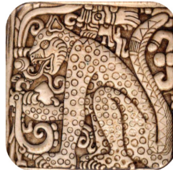
En la cultura Maya era símbolo de poder