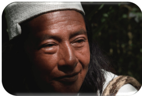
El pueblo Arhuaco concibe a los jaguares como los guardianes del conocimiento