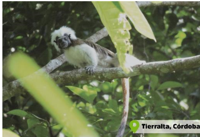
Tití cabeciblanco ( Saguinus oedipus )