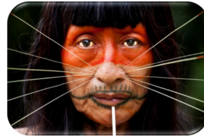
Mujer Matsés del clan Jaguar, en la frontera entre Perú y Brasil