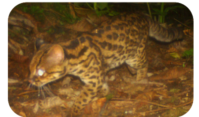
Oncilla ( Leopardus tigrinus )