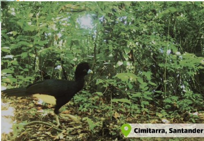
Paujil de pico azul ( Crax alberti )