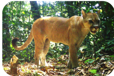
Puma ( Puma concolor )