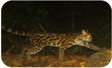
Margay ( Leopardus wiedii )