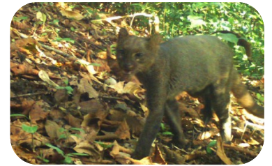
Yaguarundi ( Herpailurus yagouaroundi )