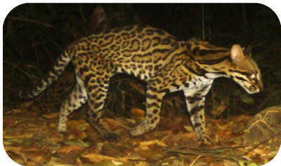
Ocelote ( Leopardus pardalis )