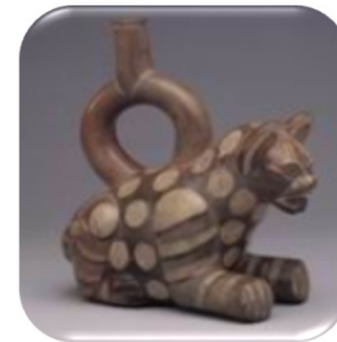
Jaguar de la cultura Moche Museo Larco