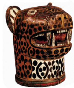
Vaso ceremonial inca representando un jaguar