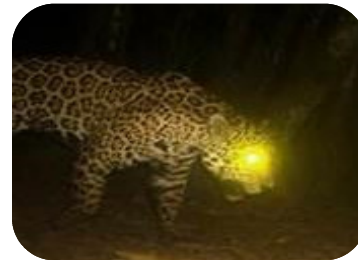
Jaguar ( Panthera onca )